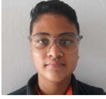
श्रीसद् शिवाकोटी क्रमाङ्कः २७०१४ विद्यालय जाने चाहना

नेपाल प्रकृतिको सुन्दरताले भरिएको देश हो । यहाँ विकसित ठाउँहरू पनि छन् र दुर्गम अविकसित ठाउँहरू पनि छन् । विकसित ठाउँहरू सबै सुविधा सम्पन्न छन्, भने दुर्गम ठाउँतिर बाटो पनि पुगेका हुँदैनन् ।