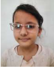
उद्धती भद्राई क्रमाङ्कः ३२०४० बास्केटबल

मलाई मन पर्ने खेल बास्केटबल हो । यो समूहमा खेलिने खेल हो । प्रत्येक समूहमा पाँच पाँच जना खेलाडीहरू हुन्छन्। यो आयताकार मैदानमा खेलिन्छ । मैदानको दुवैतर्फ १० फिटको उचाइमा बास्केटबल राखिएको हुन्छ । खेलाडीहरूले आपसमा तालमेल गर्दै अर्को समूहको बास्केटमा बल छिराउने प्रयास गर्छन् । यसरी गोल गर्दा दूरीका आधारमा दुई वा तीन अङ्क पाइन्छ । खेलको अन्त्यमा जुन समूहको बढी अङ्क हुन्छ त्यही समूह विजयी हुन्छ । बास्केटबल फुटबलभन्दा ठूलो आकारको हुन्छ । यसमा बललाई भुइँमा ठोक्काउदै उफार्दै अघि बढाइन्छ । यसमा साथीभाइ बिचको तालमेल निकै महत्त्वपूर्ण हुन्छ । बास्केटबल खेल्दा शरीरका सबै अङ्गहरूको राम्रो व्यायाम पनि हुन्छन् । त्यसैले मलाई यो खेल मनपर्छ । यो खेल संसारभरि निकै लोकप्रिय छ । कतिपय देशमा त व्यावसायिक रूपले बास्केटबल खेलिन्छ । आजकाल स्कुल कलेजहरूमा पनि बास्केटबल मैदान बनाइएको हुन्छ । हाम्रो विद्यालयमा पनि यो सुविधा छ । मलाई जस्तै मेरा साथीहरूलाई पनि बास्केटबल खेल्न मन पर्छ ।