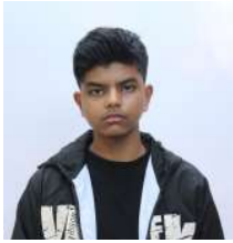
Suprabh Acharya Roll no: 27014 Rise and Fall of Silk Road : A Dark Web Empire

Ross Ulbricht, a 29 year old man was arrested by federal agents on October 1, 2013 in San Francisco public library. Ross Ulbricht had been running the largest online business for illegal drugs in history, known as Silk Road. Silk Road operated in the depths of the dark web, where it processed around $214 million in sales over 2 years.