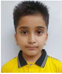
अनुप्रस्थ लुइटेल क्रमाङ्कः ३००५८ जलवायु परिवर्तन र यसको असर