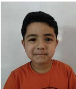
Arsan Bajimaya Roll: 34007 Elephants

अन्ततः आफ्ना आमाबुवालाई उसले रहस्य बुझी भनेसकेपछि, निराना उत्साहित हुँदै आफ्ना आमाबुवालाई दिदीलाई भेट्न आग्रह गरी । उनीहरूले उसकी दिदी घरमा कतै लुकेकी छिन् भने त्यसैले अब निरानाले दिदीलाई खोज्न अर्को साहसिक यात्रा गर्नुपर्ने । घरका हरेक कुना-कुना खोजेपछि निरानाले अन्ततः दिदीलाई भेट्टाई र उनीहरूको पारिवारिक माया बढ्दै गयो । यदि निरानाको पर्यवेक्षक दिमाग नभएको भए सायद उसले कहिले पनि आफ्नी दिदी फर्केर आएको महसुस गर्ने थिइन ।